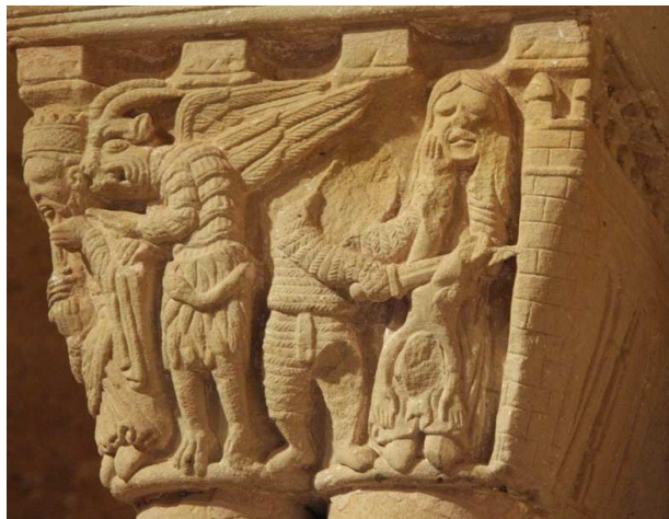
Capitel del baldaquino sur de la iglesia de San Juan de Duero, Soria (España), finales del s. XII.