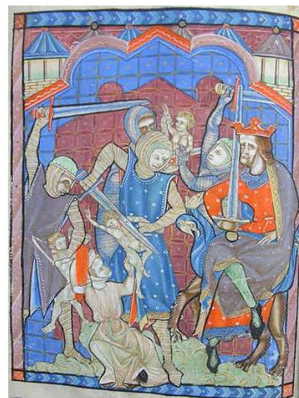
▲ Detalle del fol. 15v. (c. 1270-1280) inserto en el Ms. K. 26 del St. Jonh's College de Cambridge (Inglaterra).

http://www.fixcas.com/cgi-bin/herod.py?K26f15v [captura 30/05/2011]