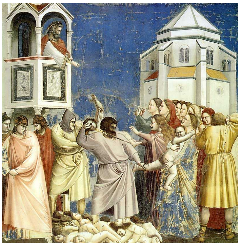
Giotto, pinturas murales de la Capilla Scrovegni, Padua (Italia), primera década del s. XIV.