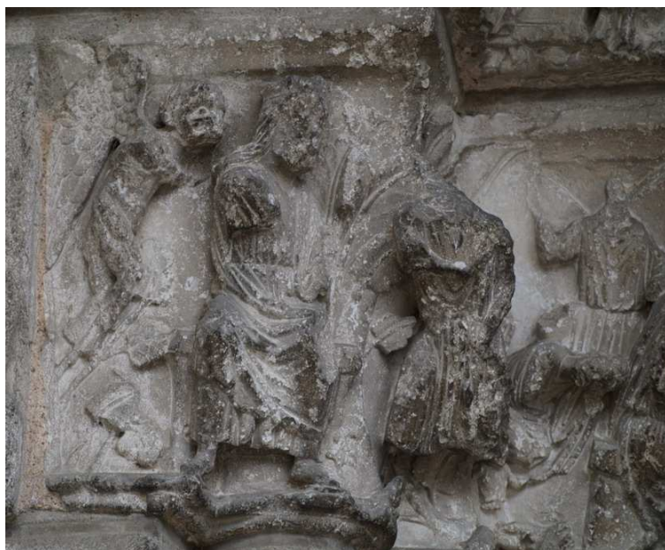
◀ Capitel de la portada septentrional de la catedral de Poitiers (Francia), finales del siglo XII.

http://visualiseur.bnf.fr/ConsulterElementNum?O=IFN-07805787&E=JPEG&Deb=1&Fin=1&Param=C [captura 30/05/2011]