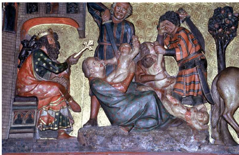
Detalle del trascoro de la catedral de Notre-Dame de París (Francia), segundo cuarto del s. XIV.