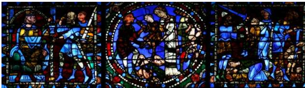
Vidriera de la vida de Cristo, hastial occidental de la catedral de Chartres (Francia), c. 1150.

http://www.sacreddestinationsimages.com/photo?id=080719162752 [captura 30/05/2011]