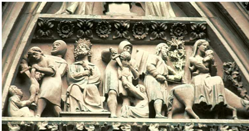
Detalle del tímpano norte de la fachada occidental de la catedral de Estrasburgo (Francia), finales del s. XIII.

http://www.bluffton.edu/~sullivanm/strasbourg/westntympdet.jpg [captura 30/05/2011]