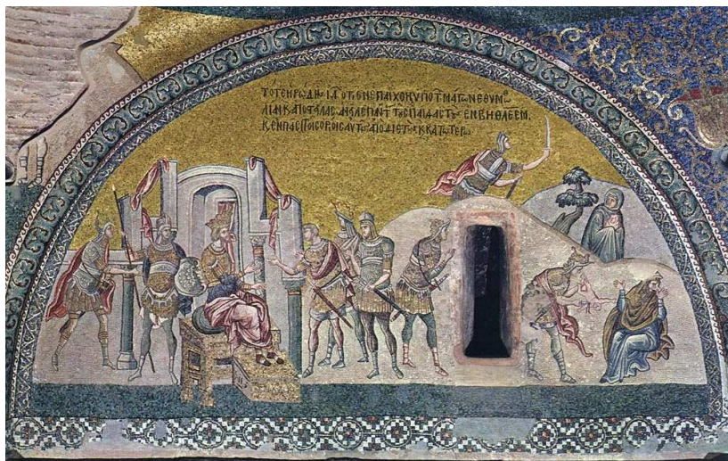
◀ Luneto del exonártex de San Salvador de Chora, Estambul (Turquía), principios del s. XIV.

http://www.fixcas.com/cgi-bin/herod.py?Duccio [captura 30/05/2011]