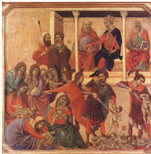
Duccio, Maestà (detalle), 1308-1311. Siena (Italia), Museo dell'Opera del Duomo.

http://www.fixcas.com/cgi-bin/herod.py?Pisano1 [captura 30/05/2011]