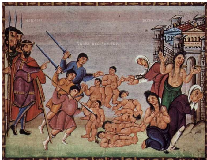
◀ Codex Egberti, Reichenau (Alemania), c. 980-993. Stadtbibliothek Trier, Ms. 24, fol. 15v.