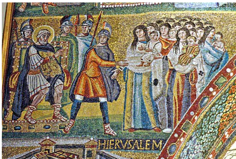
▲ Detalle del arco triunfal de Santa María la Mayor, Roma (Italia), c. 430.

http://www.paradoxplace.com/Perspectives/Rome%20%20Central%20Italy/Rome/Rome_Churches/Santa_Maria_Maggiore/Santa_Maria_Maggiore_Triumphal_Arch/T_Arch_Images/800/6-Slaughter-May05-DS2791sAR.jpg [captura 30/05/2011]