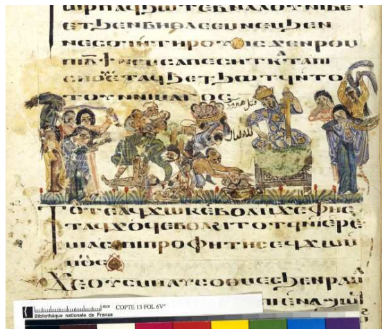
Biblia, Damietta (Egipto), 1178-1180. París, BnF, Ms. Copte 13, fol. 6v.

http://visualiseur.bnf.fr/ConsulterElementNum?O=IFN-07805787&E=JPEG&Deb=1&Fin=1&Param=C [captura 30/05/2011]