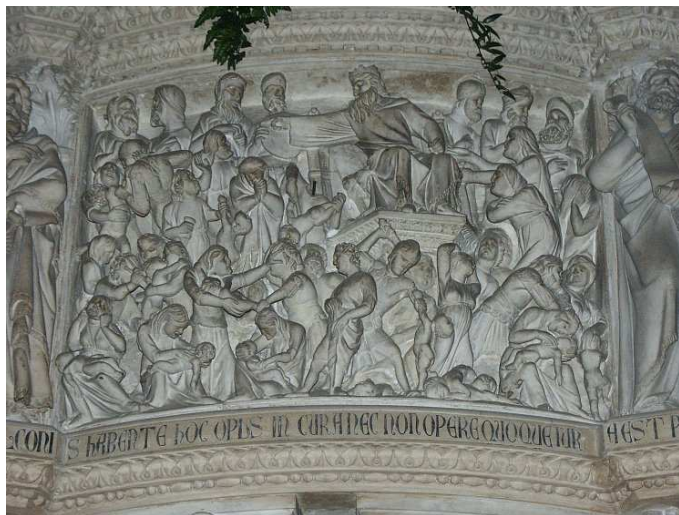
Giovanni Pisano, Púlpito de la catedral de Pisa (Italia), c. 1302-1311.

http://www.fixcas.com/cgi-bin/herod.py?Pisano1 [captura 30/05/2011]