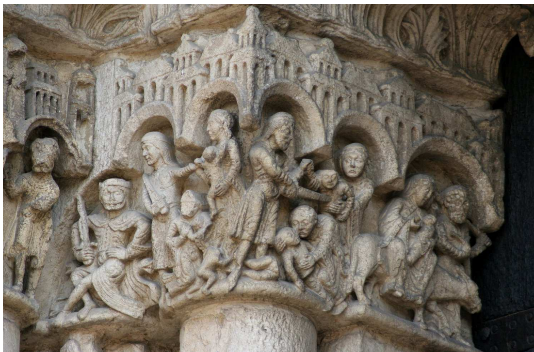
▲ Detalle del friso del Pórtico Real de la catedral de Chartres (Francia), mediados del s. XII.