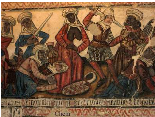
▲ Pinturas murales del muro norte de la catedral de Mondoñedo, Lugo (España), siglo XV.

http://visualiseur.bnf.fr/ConsulterElementNum?O=IFN-8100140&E=JPEG&Deb=11&Fin=11&Param=C [captura 30/05/2011]