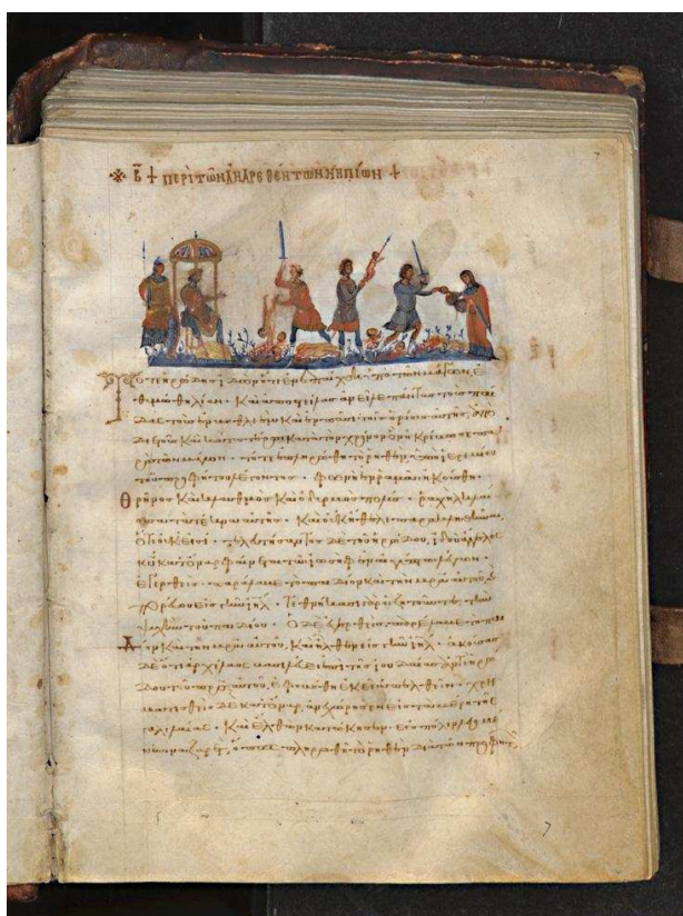
▲ Tetraevangelio, siglos XI-XII Constantinopla. Florencia, Biblioteca Medicea Laurenziana, Ms. Plut. VI. 23, fol. 7.

http://atenex2.educarex.es/ficheros_atenex/bancorecursos/18788/contenido/86db66a85d474d6dfcc2513216a5e38e86db66a85d474d6dfcc2513216a5e38e.JPG [captura 30/05/2011]