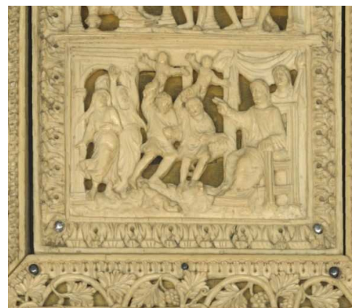
▲ Detalle de la cubierta del Ms. Lat. 9393, París, BnF (anteriormente en la cubierta del Ms. Lat. 9388 de la BnF), Metz, s. IX.

http://visualiseur.bnf.fr/ConsulterElementNum?O=IFN-08101175&E=JPEG&Deb=38&Fin=38&Param=C [captura 30/05/2011]